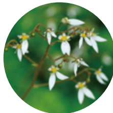
<ユキノシタエキス>