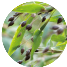
<ハトムギ種子エキス>