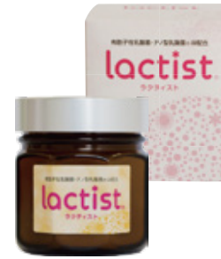
ラクティスト ＜乳酸菌含有食品＞ 120g 15,000円＋税

粉舞いによる誤嚥の心配がある場合、できるだけ牛乳やヨーグルト、スムージーなどに混ぜてお飲みください。