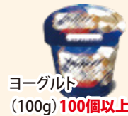
ヨーグルト (100g) 100個以上