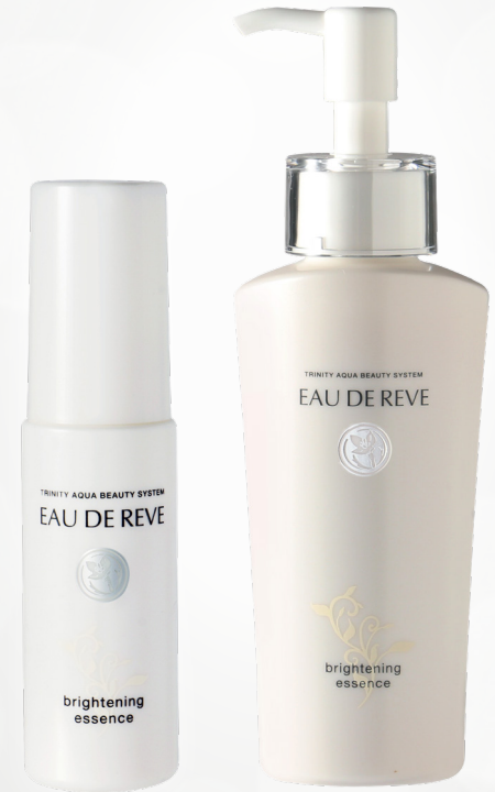
オードゥリーベ ブライトニングエッセンス