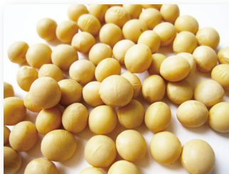
※2 ダイズ芽エキス、ダイズ種子エキス

女性の薄毛・抜け毛の原因の一つに、女性ホルモン【エストロゲン】の減少があります。【エストロゲン】は、女性らしい体を維持するだけでなく、髪の毛の成長を促進する働きがあります。メディエーラに含まれる 大豆イソフラボン ※2は、【エストロゲン】に似た働きをすることから、薄毛・抜け毛の予防や髪の毛の健康にも効果が期待されています。