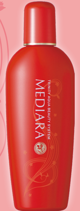
女性用スカルプローション 「メディエーラ」